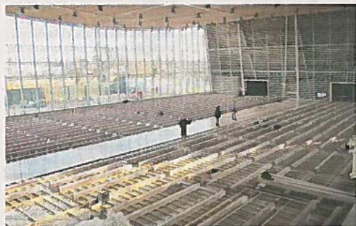
Le gymnase de Monconseil, qui borde la rue Colette, au nord du quartier, devrait être livré au mois de mai.