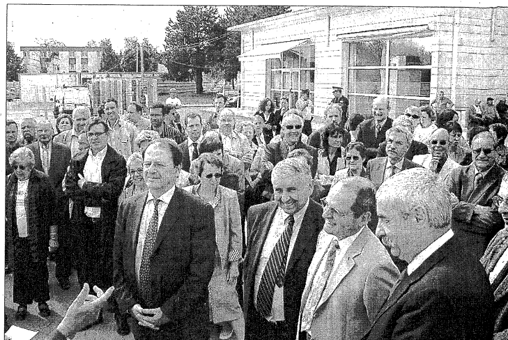
Élus, médecins, personnels de santé... étaient aussi présents.

Un chantier a été inauguré, lundi à Chinon : celui du futur Ehpad (*) des Groussins. Une maison de retraite new-look qui devrait être livrée durant l'été 2007.